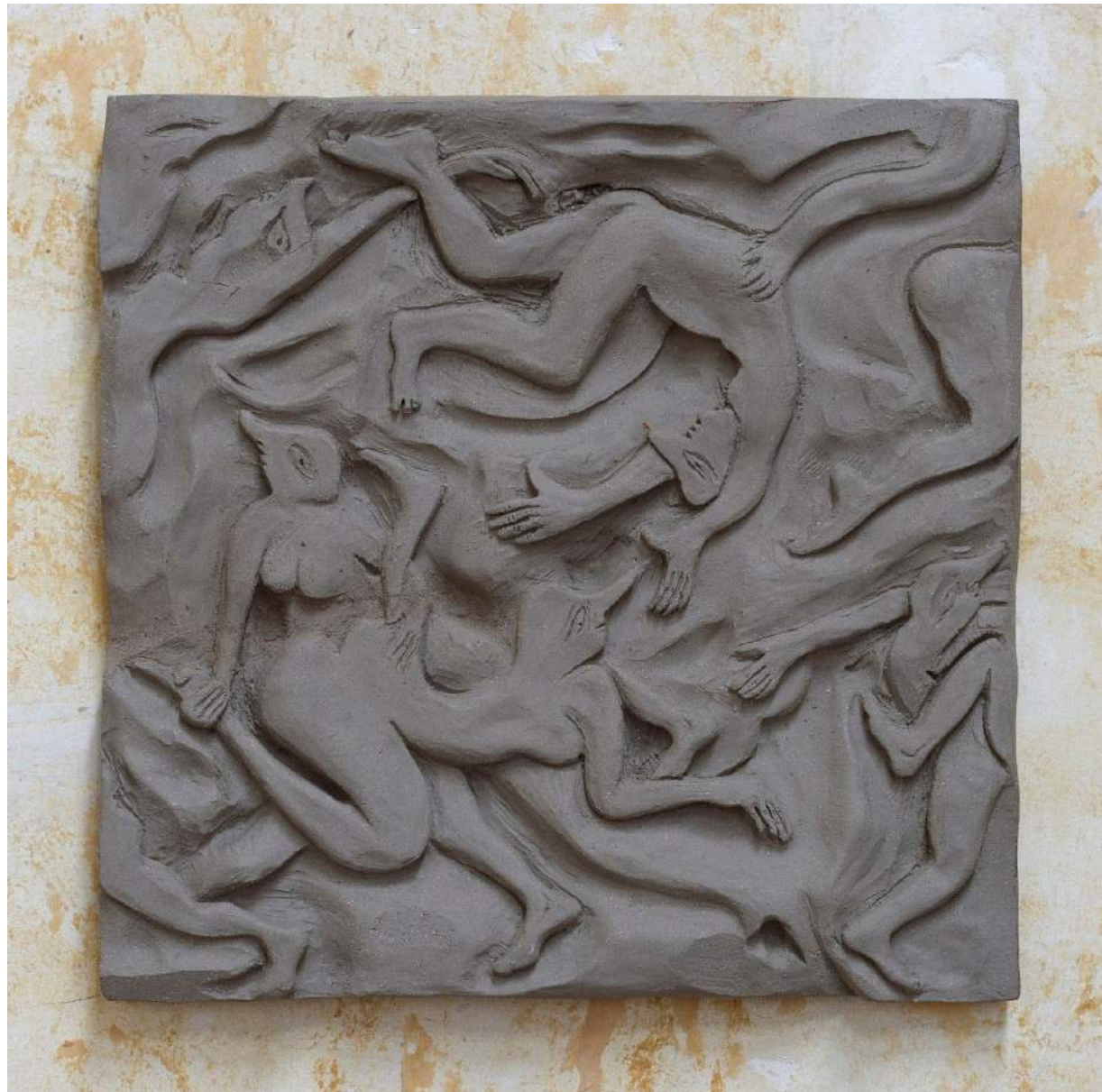
Flirt II 2017 Earthenware 36,5 x 36,5 x 2,5 cm