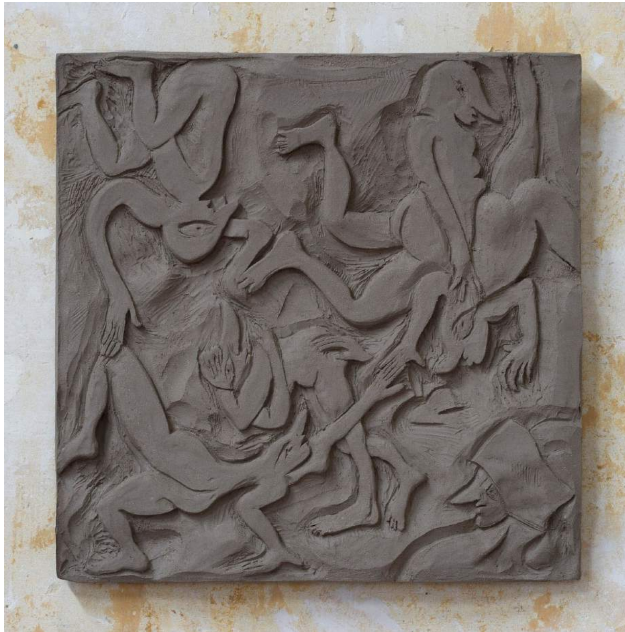
Flirt III 2017 Earthenware 36,5 x 36,5 x 2,5 cm