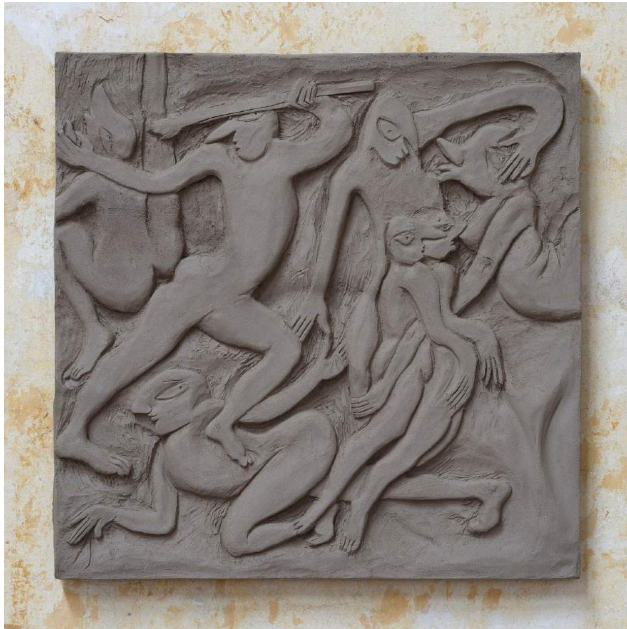
Flirt IV 2017 Earthenware 36,5 x 36,5 x 2,5 cm