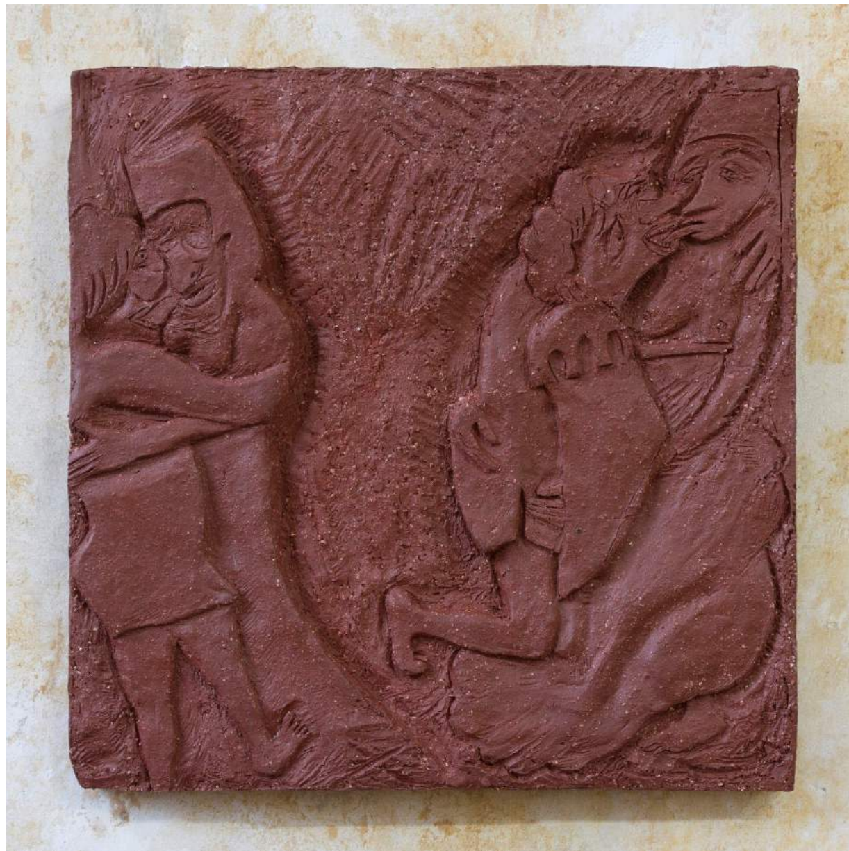
Le chant de la boue 2017 Earthenware 36,5 x 36,5 x 2,5 cm