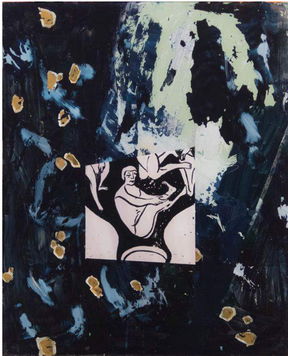
Les oxydations du monde I 2016 Acrylic and pigments on glass 70 x 55 cm