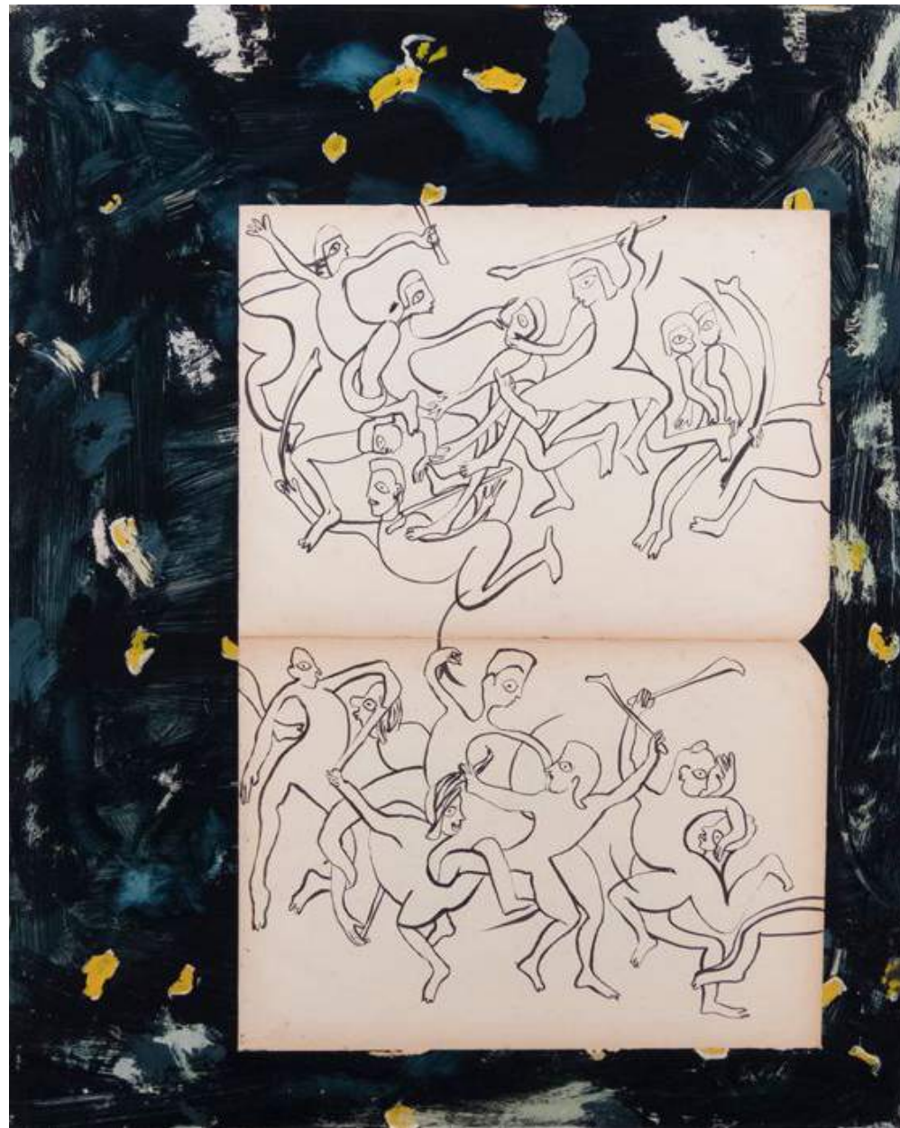
On est pas là pour faire de la poésie II 2016 Acrylic and pigments on glass, ink on paper 70 x 55 cm