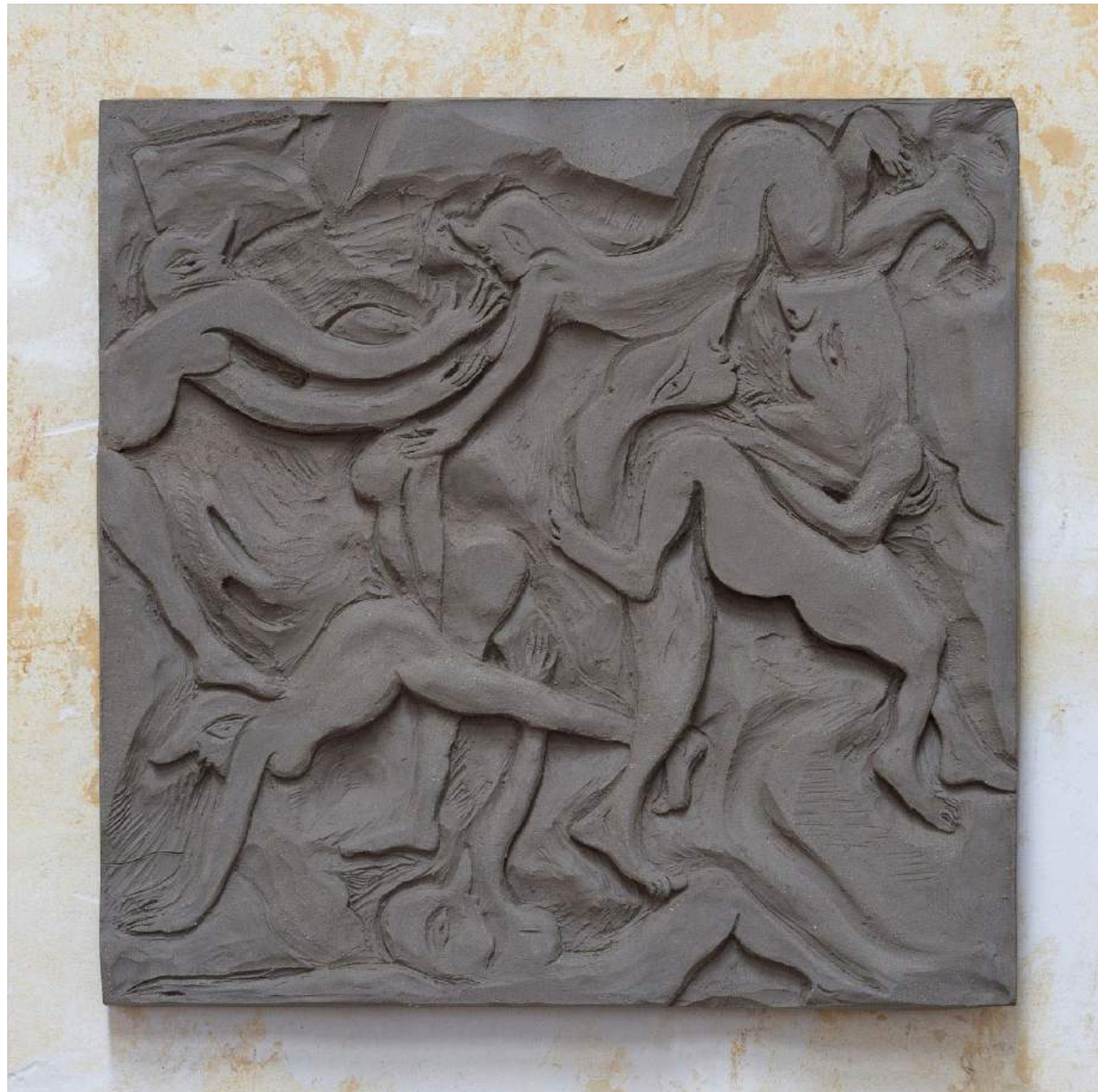
Flirt I 2017 Earthenware 36,5 x 36,5 x 2,5 cm