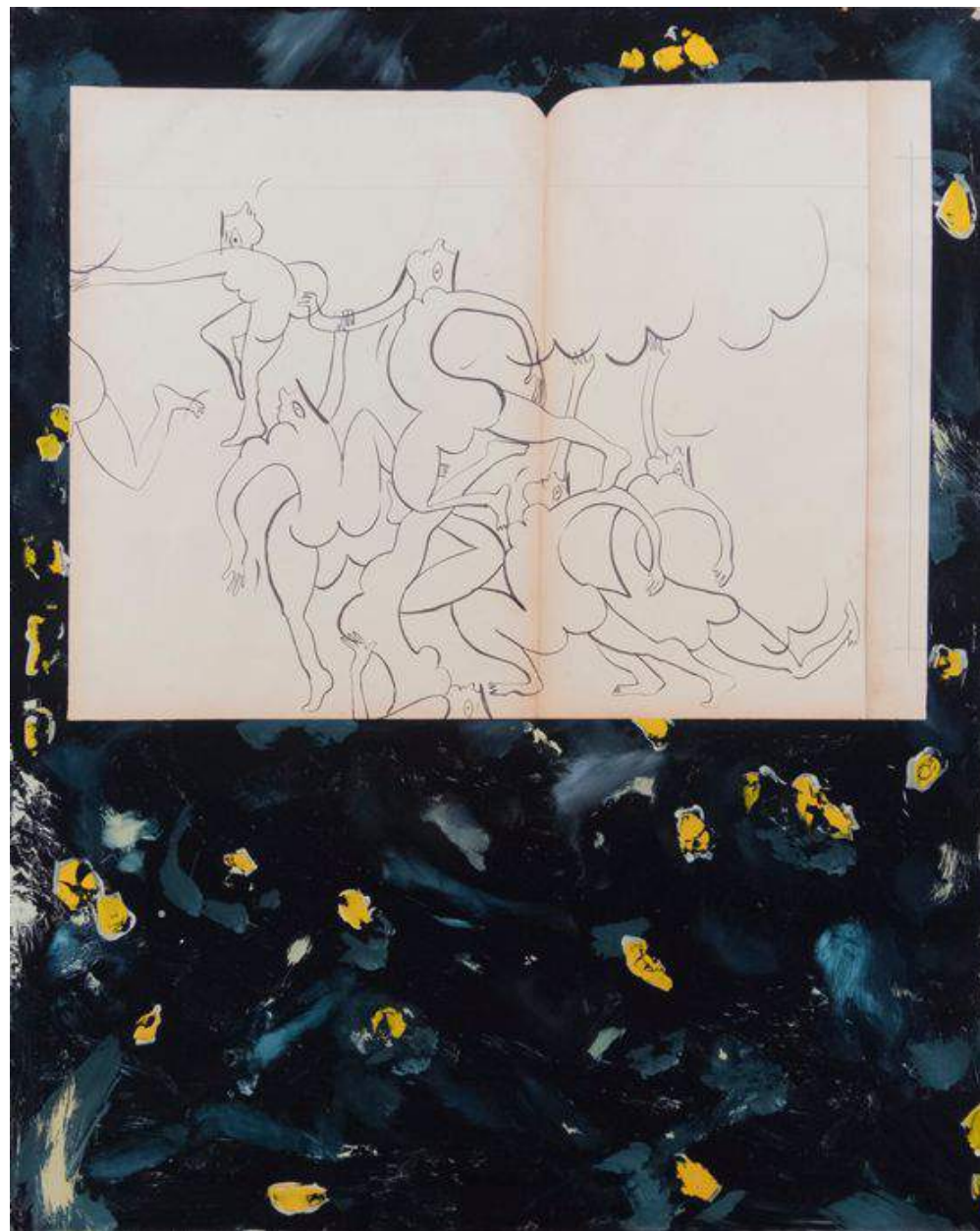
On est pas là pour faire de la poésie I 2016 Acrylic and pigments on glass, ink on paper 70 x 55 cm