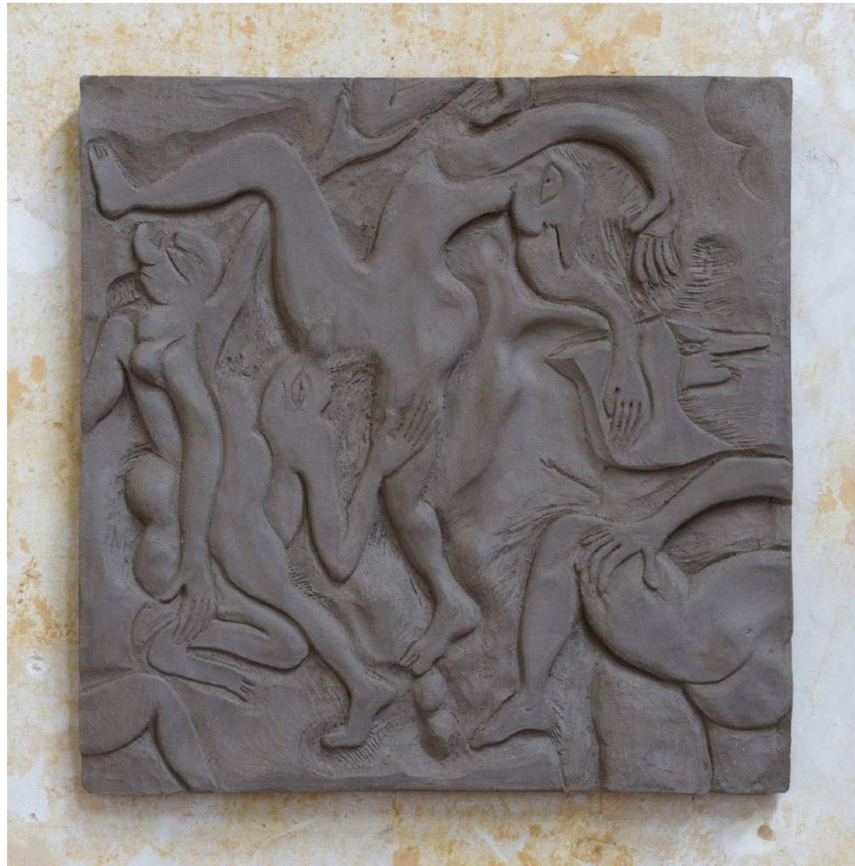
Flirt V 2017 Earthenware 36,5 x 36,5 x 2,5 cm